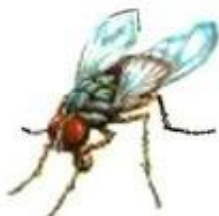
Муха жужжит. Жжу-жжу-жжу.