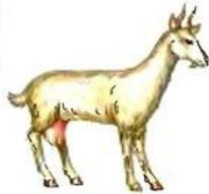
Коза блеет. Бе-бе-бе.