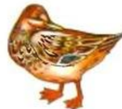
Утка крякает. Кря-кря-кря.