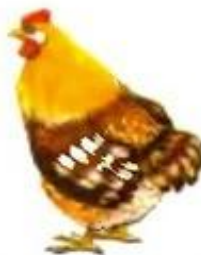
Курица кудахчет. Куд-куда. Куд-куда.