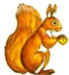
Белка цокает. Цок-цок-цок.