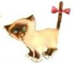
Кошка мяукает. Мяу-мяу-мяу.