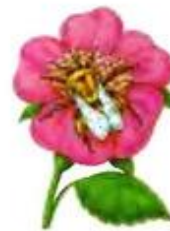
Пчела жужжит. Жж-жж-жж.