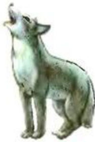
Волк воет. У-у-у-у.