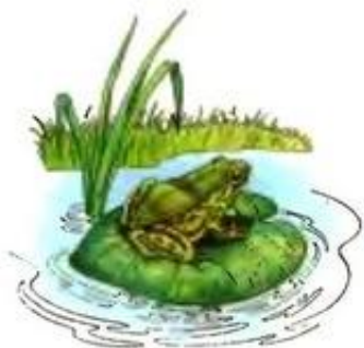
Лягушка квакает. Ква-ква-ква.