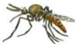
Комар пищит. Пи-пи-пи.