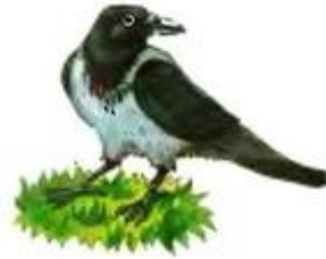
Ворона каркает. Кар-кар-кар.