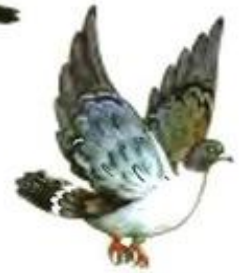
Голубь воркует. Гуль-гуль-гуль.