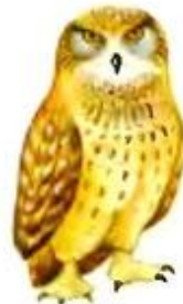
Сова ухает. Ух-ух-ух.