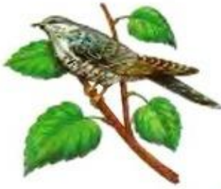
Кукушка кукует. ку-ку, ку-ку.