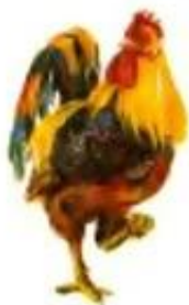
Петух кукарекает. Ку-ка-ре-ку.