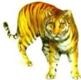
Тигр рычит. Рр-рр-рр.