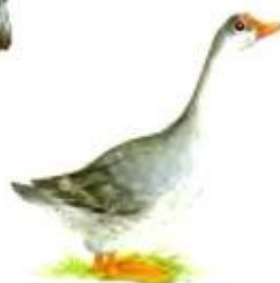
Гусь гогочет. Га-га-га.