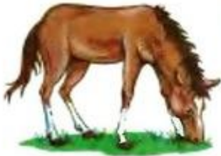
Лошадь ржёт. И-го-го.