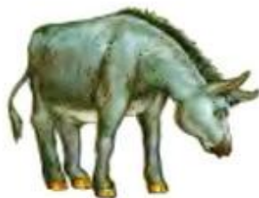
Осёл кричит. Иа-иа-иа.