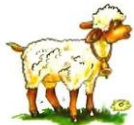
Овца блеет. Бе-бе-бе.