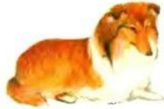
Собака лает. Гав-гав-гав.